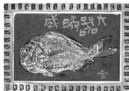
▲中川一政「鯛・大器晩成」1977年 ／白山市立松任中川一政記念美術館蔵