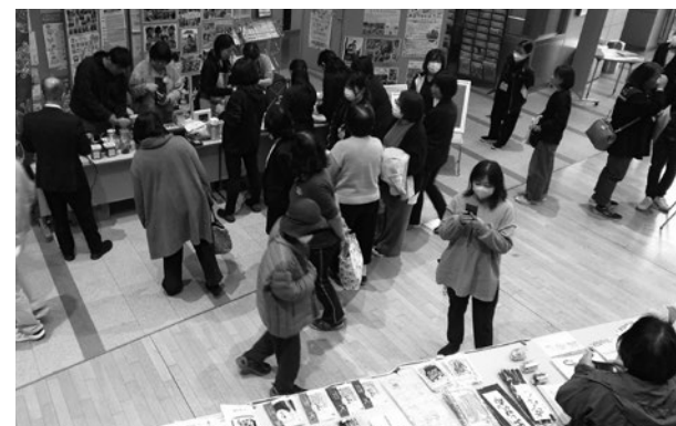
▲昨年度の「@っとひろしま!マルシェ」様子