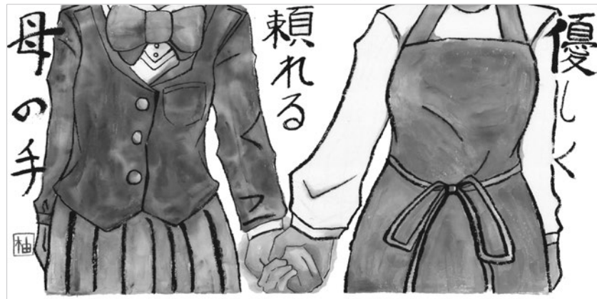
▼一般部門 佳作受賞作品(水戸 柚奈(熊高1年))

また、子ども部門では、中学生以下の優秀作品1,103点を紹介します。子ども部門の奨励賞作品については、前期に県内の受賞作品、後期に県外の受賞作品を展示します。