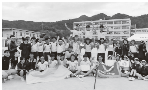
▲第44回体育祭 優勝 黄団 (教育総務課)