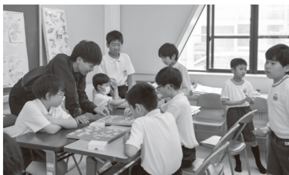
▲「くま SUN 和く・湧くファミリールーム」の様子 (教育総務課)