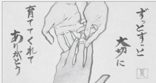
▲第26回優秀賞受賞作品 小泉夏希(熊野高校1年) ※学年は応募時点