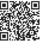
町ホームページはこちら▲

令和7年1月8日(水)~24日(金) 8:30~17:00（土日祝を除く） 子育て支援課、各放課後児童クラブ（継続の人のみ） ※新規申込者には就労状況や入会児童について窓口での聞き取りを行います。