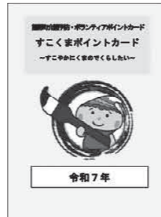
令和7年用▲「すこくまポイントカード」