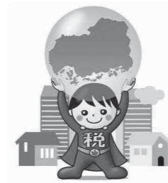
広島県地方税納税推進キャラクター ささえくん