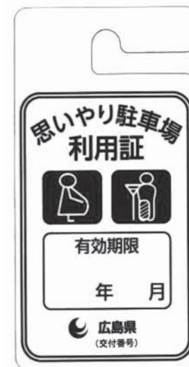
▲思いやり駐車場利用証