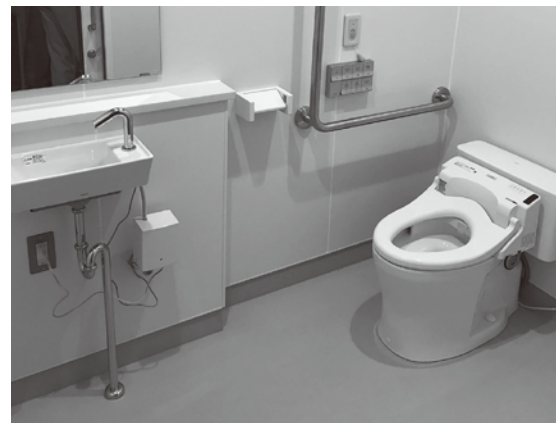
※写真は令和4年度に行った熊野東中学校の洋式化工事完了後のものです。