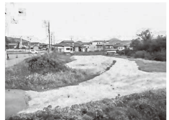
▲売却可能な町有財産(川角一丁目641番1)

ふるさと納税の寄付金や町有地売却などの収入を活用して、財政運営の健全性を確保する。