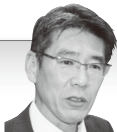
水原 耕一 議員