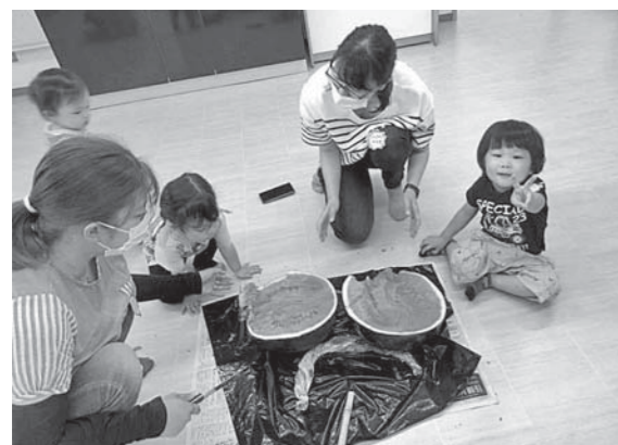
▲7月「スイカ割り」、8月「ヨーヨー釣り」の様子

工作や公園に行ってお飯を食べたり、メンバーで活動内容を決めて楽しく活動しているグループです。一緒に親子で仲間作りをしましょう。興味のある人、お友達同士での誘い合わせでの体験参加もOK。気軽にお問い合わせください。 ▷活動日・毎月1回(午前中2～3時間程度) 所くまの・こども夢プラザを中心に活動