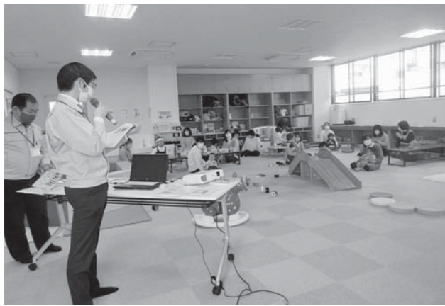
▲前回開催した時の様子

地震が起きた時、子どもの命を守るためにどう行動すればよいか一緒に考えてみませんか。 ☎3月10日(金)10:30～11:30 ▷テーマ・「子どもを守る防災・減災～もし地震が起きたら～」(防災安全課の職員がお話します)