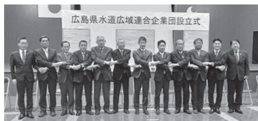
▲広島県水道広域連合企業団設立式の様子 (上下水道課)

広島県、竹原市、三原市、府中市、三次市、庄原市、東広島市、廿日市市、安芸高田市、江田島市、熊野町、北広島町、大崎上島町、世羅町、神石高原町