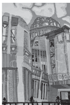
広島県知事賞 勢川真健 「平和公園の中の原爆ドーム」

1月30日(月)~2月3日(金) 熊野町役場エントランスホール 社会福祉課☎820-5635