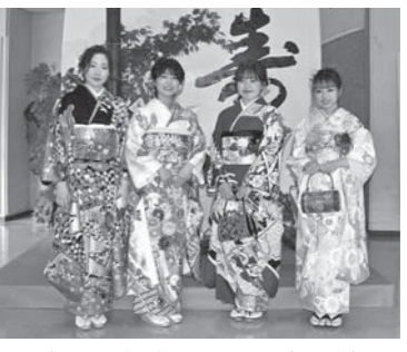
▲令和4年成人を祝う会の様子