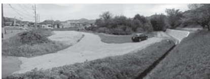
◀川角一丁目町有地

☑申込要領を財務課で配布します(熊野町ホームページにも掲載)。なお、申し込みおよび入札は郵送(簡易書留)または直接持参の方法により受付します。