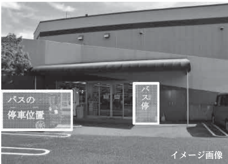
▲フジ熊野店の北側入口前 (バスを待つ場合は店内の待合場所を利用できます)