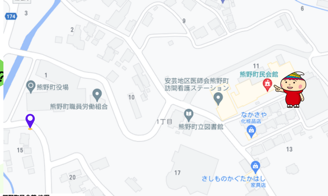
熊野町民会館 地図