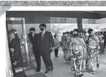
▲町民会館に集う新成人