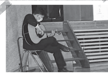
▲実行委員の圧巻のギター演奏が会場に響き渡る

令和4年成人を祝う会 5月1日(日)に「成人を祝う会」を町民会館で開催しました。熊野町の「成人を祝う会」は新成人自らが実行委員となり、何度も打ち合わせを重ね、工夫しながら作り上げていきます。 当日は、感染症対策を実施しながら式典が行われました。式典のオープニングでは、成人を祝う会実行委員会の企画したギター演奏が披露され、会場では、恩師との再会や久しぶりに会う友人との会話を楽しんでいました。 (教育総務課社会教育グループ)