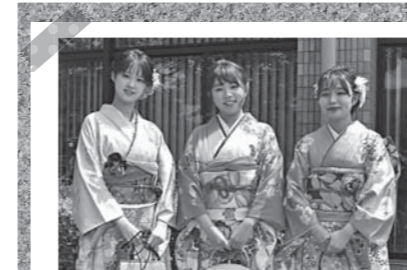
▲久しぶりの再会に輝く笑顔 ※撮影のためマスクを外しています