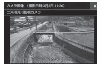
▲ 河川の様子が確認できます