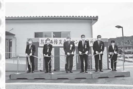
▲4月2日(土)に新館の開所式を行いました。

4月1日(金)に熊野西防災交流センター（旧：くまの・みらい交流館）の新館が開館しました。旧くまの・みらい交流館を「本館」とし、新たに増築した「新館」には、備蓄倉庫やシャワー室などが備わっており、ペットとの同行避難にも対応しています。非常時は防災拠点施設として、通常時は今までどおり生涯学習の拠点施設としてご利用いただけます。（新館のみ、土足禁止となります。）