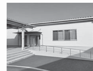
▲増築した新館部分