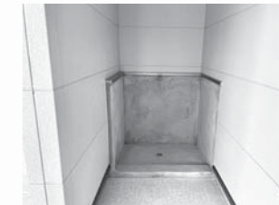
▲ペット専用足洗い場