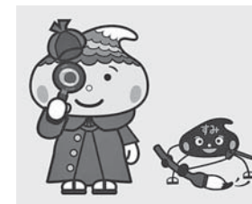
ふでりんとスーミー

熊野町観光PRキャラクター・ふでりんが探偵となり、筆の里工房の収蔵品を紹介する参加型の展示会です。