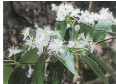
▲熊野の自然 (296) ハイノキ