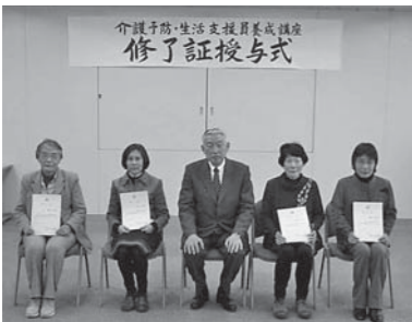
▲修了証授与式の様子

介護予防・日常生活支援総 合事業における訪問型サービ スAの事業所で生活支援サー ビス(調理、掃除、買い物な ど)を提供する担い手を養成 するため、令和3年度熊野町 介護予防・生活支援員養成講 座を開催し、6人が全課程を 修了されました。