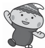
熊野町地域包括支援センタースタッフ（高齢者支援課）