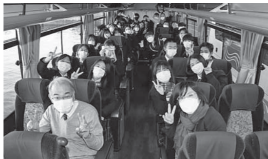
▲淡路・四国修学旅行の様子 ◎熊野高等学校 ☎854-4155

全行程、晴天に恵まれ、机上ではできない体験や見学は貴重な学びとなりました。そしてなによりこの修学旅行に関係した多くの方々への感謝の気持ちいっぱいの旅でした。