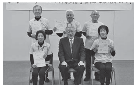
▲熊野町初 1級指導士の皆さん