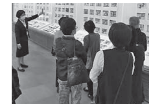
▲ギャラリートーク風景

時2月1日(火)~27日(日) ¥PAL会員・2,000円 ジュニア会員・1,000円 ファミリー会員・5,000円 スーパー会員・10,000円