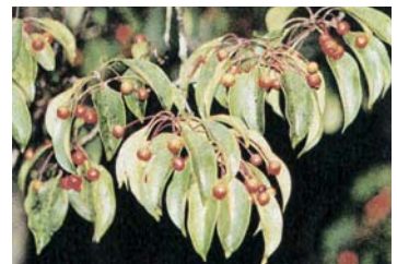
▲熊野の自然 (101) ソヨゴ