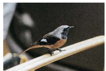
▲熊野の自然 (113) ジョウビタキ