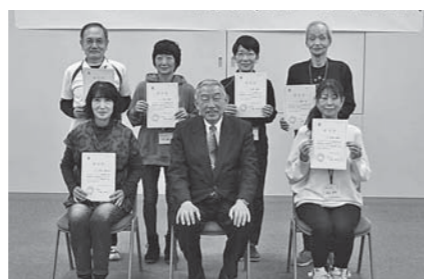
▲3級指導士の皆さん

町では、地域共生社会の実現に向け、シルバーリハビリ体操指導士養成事業に取り組んでいます。この事業では、住民が住民を育てることの出来るシステムの構築として、行政とともに3級および2級の指導士を養成できる1級指導士の養成を目指してきました。このたびの3級指導士は、1級指導士の実習により養成され、誕生した人たちです。今回の1級指導士の誕生により、町が目指してきたシステムは、ひととおり完成したこととなります。今後は、行政と主に1級指導士が連携して地域づくりに取り組み、指導士養成事業を推進します。