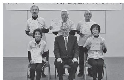
▲熊野町初 1級指導士の皆さん