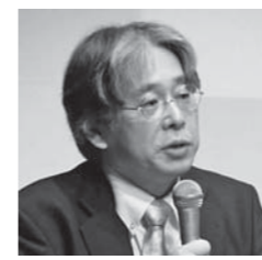
名児耶明 (日本書道史研究者)