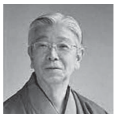
上田宗岡 (茶道上田宗箇流家元)