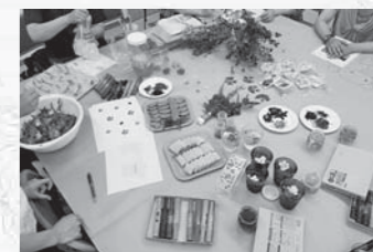
商品開発の企画会議