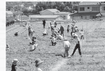
畑づくりと苗植え

ハーブを新たな町の特産品として育てていくため、2018年から、有志の仲間とともにハーブの効用や活かし方を学び、畑を耕し、商品づくりに挑戦し…ハーブを楽しむ仲間の輪を広げてきました。今年も春から活動を始めたいと思っていましたが、新型コロナウイルスの影響により、活動計画を練り直しています。ハーブに関心のある皆さま、何か始めたいと思っている皆さま、まずはご家庭でハーブに触れて、香って、自分なりの楽しみ方を探ってみませんか？