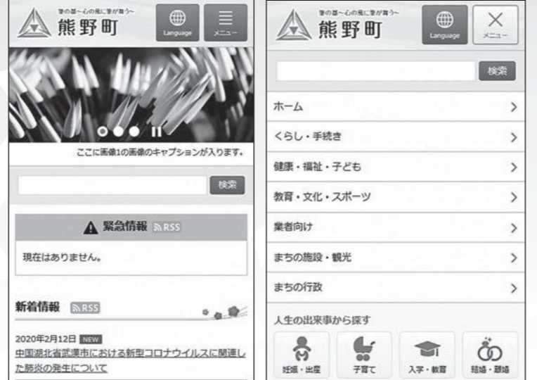
※レイアウトは変更となる可能性があります