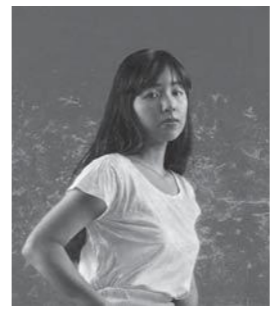
大矢英雄「祝祭の朝」 広島市立大学芸術資料館蔵

入館料《特別料金》 大人 300円 小中高生 150円 未就学児、PAL会員無料