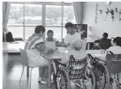
「福祉・介護の現場」体験の様子

参加に消極的だった生徒もいましたが、体験後のアンケートでは99%の生徒が満足したと答え、大変貴重な『体験』となりました。私たち教師にとっても、一人ひとりの生徒が社会に貢献できる人材であることを確認できた素晴らしい『体験』でした。