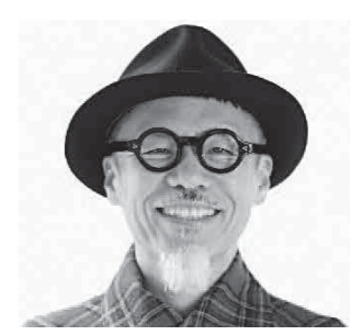
長谷川義史 絵がみライブ&サイン会

前期: 1月28日(火)～2月9日(日) 後期: 2月11日(火・祝)～24日(月・振休) 水彩画、油絵、イラスト、インテリアの書、かな、絵がみ日記、友禅、アートパラダイス、キッズアート 入館料 大人 300円 小中高生 150円 未就学児 無料 PAL会員は無料です