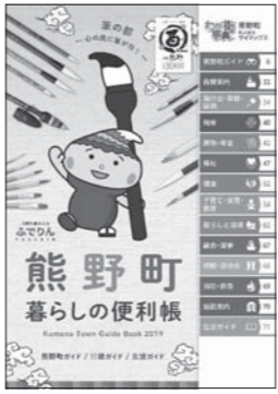
暮らしの便利帳の表紙

「熊野町暮らしの便利帳」 の第2版が完成しました。 戸別配布により、皆さま のお手元に届きます。約1 カ月(8月いっぱい)かけ て配布する予定ですので、 地区によってはお手元に届 くまで少々時間がかかるこ とがございます。ご了承く ださい。 行政情報や地域の情報な どをまとめておりますので、 ぜひ活用ください。 (総務課)