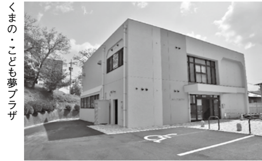
くまの・こども夢プラザ