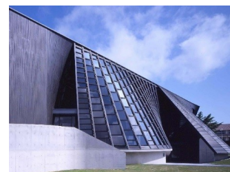
くまもとアートポリス荻北町民ホール