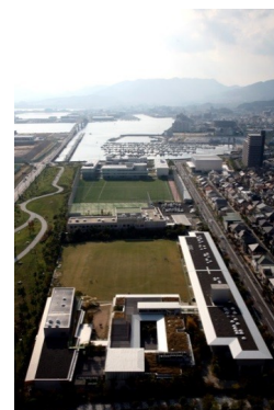
なぎさ公園小学校・広島なぎさ中学校・高等学校