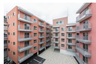
釜石市復興集合住宅