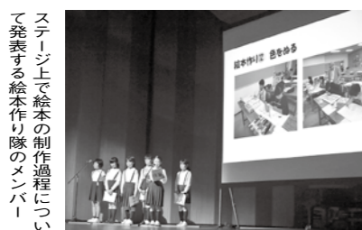
ステージ上で絵本の制作過程について発表する絵本作り隊のメンバー

10月27日に、広島県民文化センターで行われた「平成30年度青少年育成県民運動推進大会」の「青少年活動発表」にて、「くまのの絵本作り隊」のメンバーが、町制施行100周年を記念して取り組んだ絵本作りについての発表を行いました。