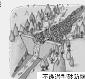
不透過型砂防堰堤