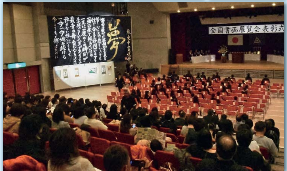
11月19日(日)に行われた全国書画展覧会表彰式の様子