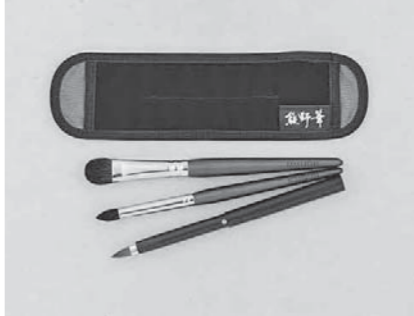
ときめき肌ポイントセット (赤)

熊野筆セレクトショップ クリスマスフェア開催 12月24日(日) 筆の里工房内の本店では、クリスマス対象商品(10点)をご購入いただく、クリスマス用にお包みます。今年のクリスマス限定セットとなりますのでぜひご利用ください。