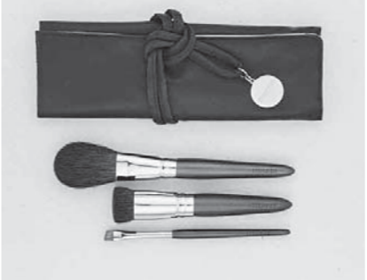
きらめき肌セット (赤)