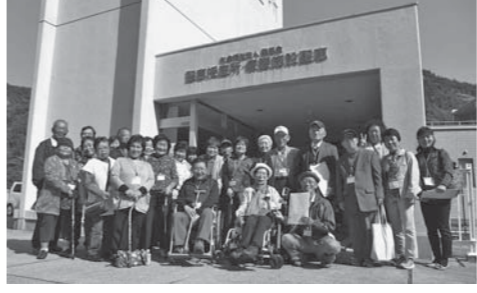
10月27日(金)の日帰り研修「ワークホーム聖恵」での写真

熊野町身体障がい者福祉協会は、障害者福祉に関する研修やレクリエーションなどを通して、身体障害者相互の連携、協調を高め、会員の親睦と福祉増進を目指して活動しています。本会では、一緒に活動する会員を募集しています。身体障害者手帳をお持ちの人なら、どなたでも会員になれますので、問合せ先までご連絡ください。