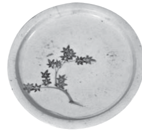
紅葉紋色絵中皿 (呉美術同好会蔵) 広島県指定重要文化財

美を愉しむ 江戸時代の茶人と文人が愛した道具類(茶道具・花器・掛軸など)、呉美術同好会が所蔵する約90点の「美」を紹介します。佐賀の有田焼や、石川の九谷焼に比する磁器として知られ、江戸時代に福山で作られていた姫谷焼(左写真)も展示します。