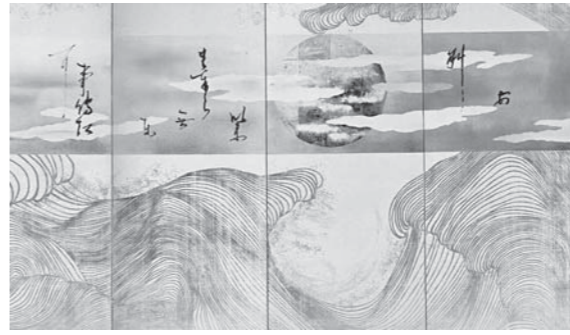
日月 (部分) (ふくやま書道美術館蔵)