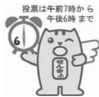
投票は午前7時から午後6時まで