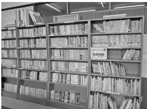
※くまどくを推進するコーナーです。(生涯学習課)

初神保育園の園児が借りに来たり、学生が勉強に使用したりと、東公民館を利用する町民の憩いの場となっています。