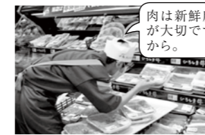
肉は新鮮度が大切です。