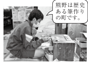
熊野は歴史ある筆作りの町です。