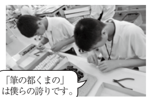
「筆の都くまの」は僕らの誇りです。