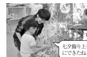
七夕飾り上手にできたね。