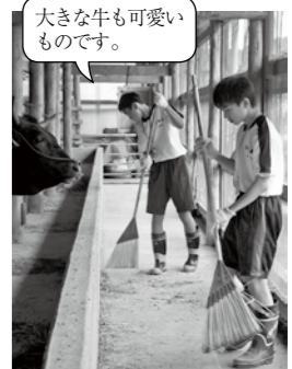
大きな牛も可愛いものです。