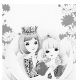
牧美也子「おやゆびひめ」 (松本零士合作)