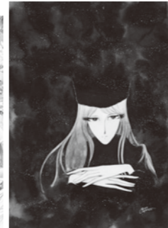
松本零士「メーテル」