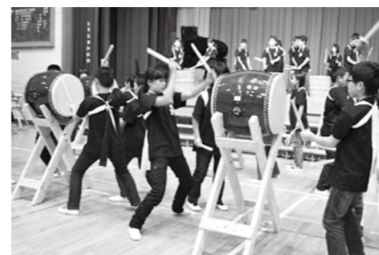
太鼓演奏の様子 (学校教育課)

昨年度、地域や保護者の方々にたくさんご協力をいただき、太鼓や児童の法被を新調することができました。午後1時30分からは、改めて地域の方にも聴いていただく予定にしています。新しい本校の伝統となる組曲「三石山の鼓動」のお披露目に、皆様お誘いあわせの上、是非お越しください。