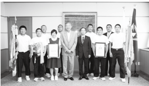
町長への報告の様子(8/11)

これにより、8月に愛媛県で開催された「第45回全国中学校柔道大会」に出場し、男子団体5位、個人戦の男子90kg級優勝、81kg級と90kg超級でそれぞれ5位という見事な成績を収められました。