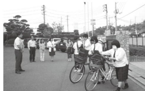
「わが子の姿を一目見てみよう運動」の様子

熊野高校は学力の向上とともに、生徒のマナー向上に取り組んでいます。今後とも地域の皆様のご支援ご指導をよろしくお願いいたします。