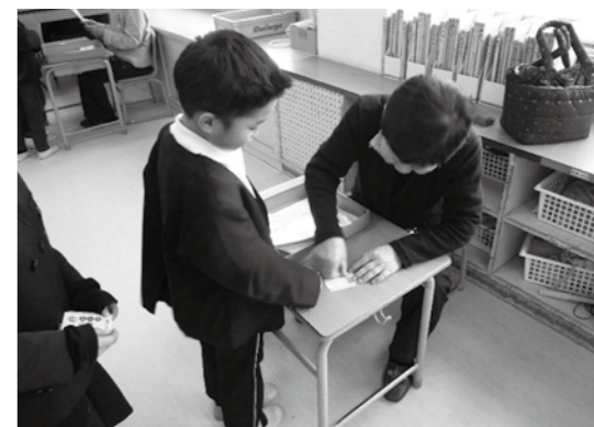
ボランティアと生徒

このように地域の方々に支えられている熊野 第三小学校です。今後ともよろしく願いたしま す。