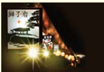
しまあかりイメージ

時3月21日(祝)〜5月11日(日) 午後6時頃〜午後10時頃 所宮島棧橋前〜厳島神社周辺 問瀬戸内しまのわ2014 4 実行員会事務局 ☎513・3450