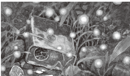
火垂るの墓《捨てられた思い出》1988年 ©野坂昭如/新潮社, ©山本二三