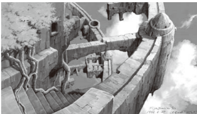
天空の城ラピュタ《荒廃したラピュタ》1986年 ©1986 二馬力・G ©山本二三