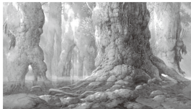
もののけ姫《シシ神の森(2)》1997年 ©1997 二馬力・GND ©山本二三