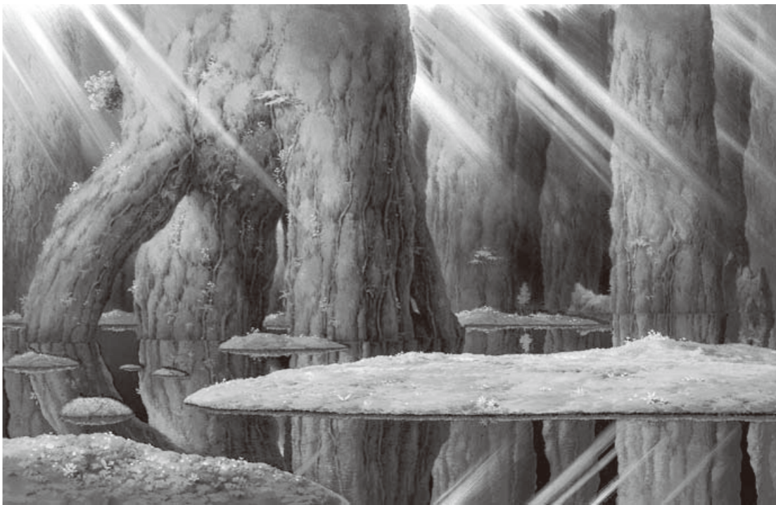
もののけ姫《シシ神の森(5)》1997年 ©1997 二馬力・GND ©山本二三

筆が生み出したこれら名作アニメ背景画の世界をこころゆくまで鑑賞ください。 ▽音声ガイド：(有料・単500円、ペア800円) 人気声優・田中真弓さん(「天空の城ラピュタ」パズー役、「ONE PIECE E」ルフィ役)と山本二三さんの声で作品を紹介します。