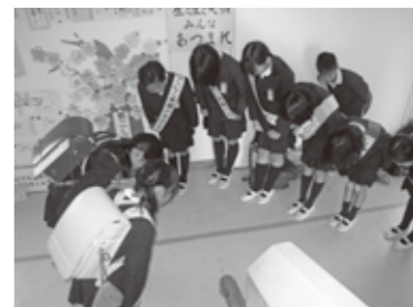
朝のあいさつ運動の様子

子どもたちは、登校班ごとに決められた曜日にいつもより10分早く学校に来て朝のあいさつ運動を行います。1階から2階へ上がる階段のところで、他の登校班の人たちを心のこもった大きなあいさつで出迎えます。お互いが気持ちのよいあいさつをかわし1日のスタートがきれいなので、みんなが元気になっています。相手の気持ちを考え、お互いが礼儀正しく振る舞うことを学ぶ、子どもたちが意欲的に行っている取り組みの一つです。