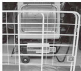
ジェットヒーターと防護柵（手前）