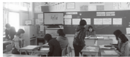
昨年度の人権参観日(懇談会)の様子

実施日：1月22日(水) 日程：13:45~14:30 授業参観 14:45~16:00 研修会