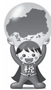
広島県地方税納税推進キャラクター ささえくん

地方税は県や市町の財源として、福祉や教育、消防救急、ごみ処理といった様々な住民サービスのために使われています。地方税の納期限は、きちんと守りましょう。納税されない、差し押さえなどの滞納処分を受けることになります。