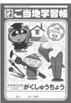
オリジナルグッズ