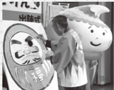
必勝祈願! 町長(後援会長)によるダルマへの目入れ

熊野町観光大使のふでりんが、熊野町の魅力や筆文化をより広くPRできるよう「ゆるキャラグランプリ2013」での上位入賞を目指してがんばっています。みなさん、ふでりんへ投票をお願いします。