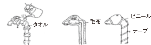
お湯をかける 毛布を巻く ビニール袋を被せる ※熱湯を直接かけるのは×

外気温がマイナス4度以下になったときなど水道が凍結して水がでなくなったり、破裂したりすることがあります。