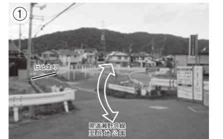
県道の道路改良工事により町道のルートが一部変わります 【道路状況（平成25年3月中）】

呉信用金庫方面からは呉出橋を渡ったところで行き止まりとなり、町道昭和線と同様に整備中の県道瀬野呉線に接続する経路に変更されます。