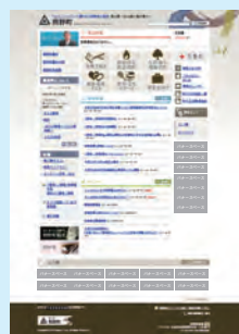
↑熊野町ホームページ