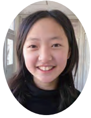
熊野第四小学校5年生