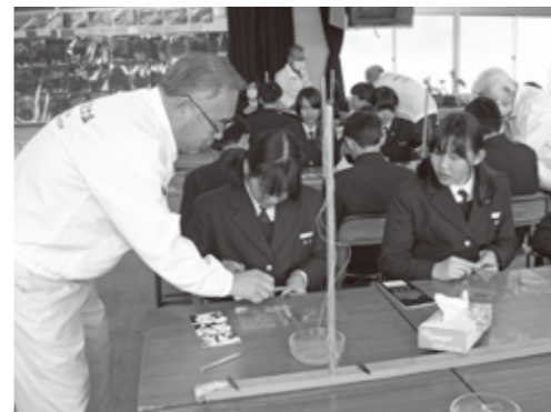
昨年の筆づくり体験の様子

毎年、生徒は職人さんの高い技に触れ、あらためて自分たちの町の世界に誇る熊野筆のすごさに驚いています。今年も真剣に筆づくりにチャレンジします。