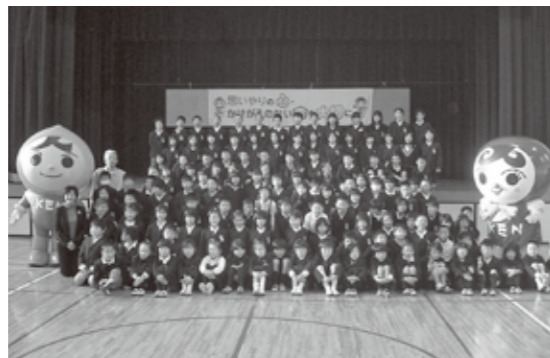
熊野第二小学校の皆さん

熊野町では、4人の人権擁護委員が活動しています。皆さんの人権相談活動や、「人権の花」のような人権啓発活動に取り組んでいます。