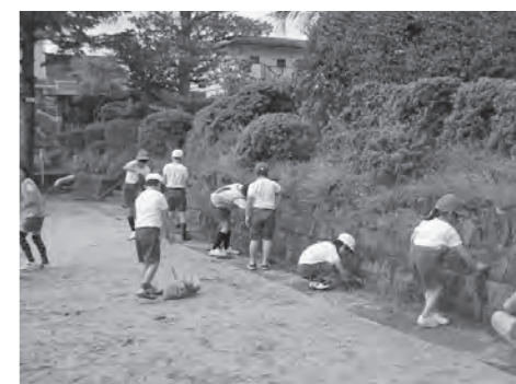
V S 朝会の様子

「気づき・考え・実行する」がこの活動の目標ですから、道徳教育と共に子どもたちの心の肥やしになることを願いつつ、V S 朝会を続けて行きたいと思っています。