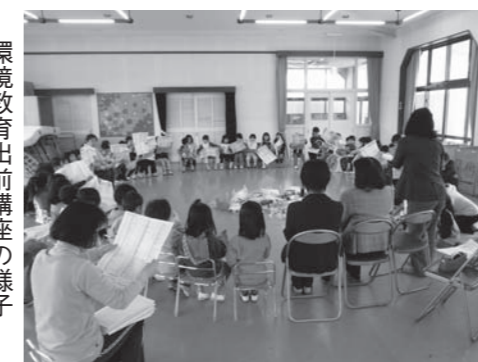
環境教育出前講座の様子

2歳以上の園児約50人が、ごみの分別ゲームをした後、子ども絵本の会による本の読み聞かせに、熱心に耳を傾けていました。